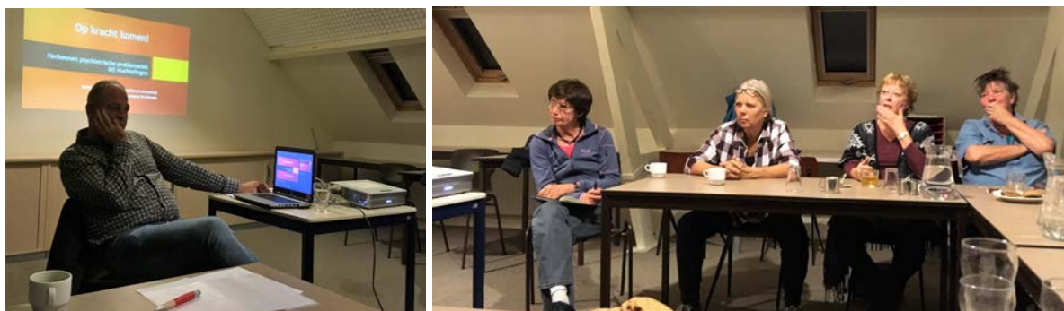
Training Braakman najaar 2018

Er was tijd tekort voor alle vragen. Er werden veel voorbeelden en oefeningen aangeboden die konden worden uitprobeerdd..