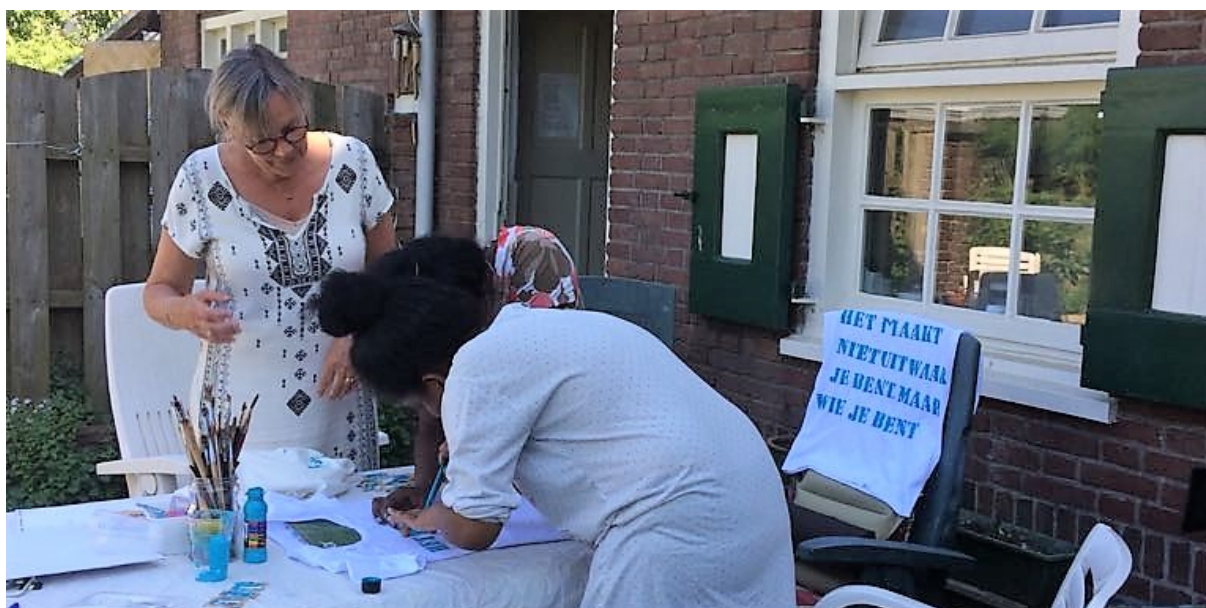
T shirts bedrukken

Elke week is er een huisvergadering waaraan alle vrouwen deelnemen. Hier wordt de gang van zaken in het huis besproken, de poetslijst en aanwezigheidslijst voor de komende week ingevuld en het leefgeld en eventueel geld voor medicijnen gegeven. Indien nodig worden de OV-kaarten (voor bezoeken aan dokter, ziekenhuis, apotheek en advocaat) opgewaardeerd.